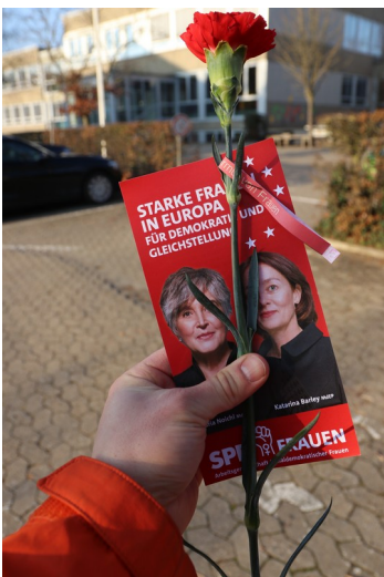
Rote Nelke mit Spruchband vor der Eichendorff Schule

Am 8. März war der internationale Weltfrauentag und man fragt sich, warum Frauen auch im Jahr 2024, also nach mehr als 100 Jahren nach Beginn der Protestbewegung, noch immer für Gleichberechtigung und gegen Gewalt von Frauen auf die Straßen gehen müssen. Das Thema betrifft uns alle: Sei es für sich selbst, für die eigene Mutter, für die eigene Tochter oder die Partnerin! Sollten wir als Gesellschaft nicht schon längst weiter sein? Sollte es nicht selbstverständlich sein, dass