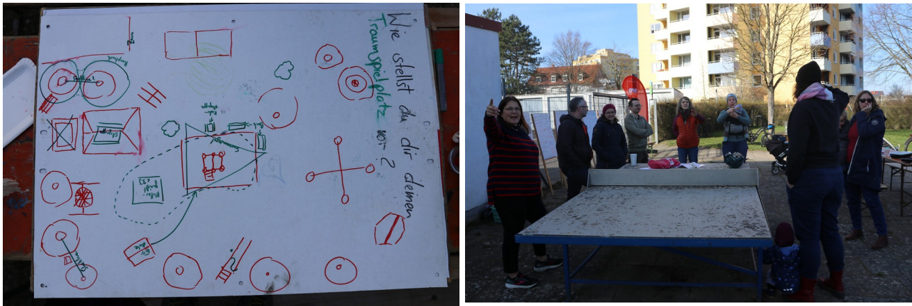
Skizze und Diskussionsrunde auf dem Spielplatz „In der Ebene“